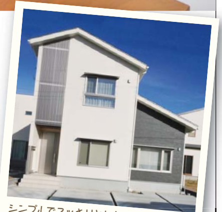
シンプルでスッキリとした外観