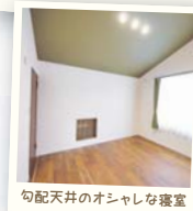
勾配天井のオシャレな寝室