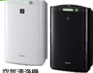
空気清浄機 プラズマクラスターイオン発生機2台