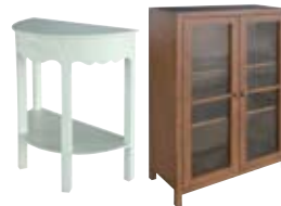
イングランド家具 ※写真はイメージです