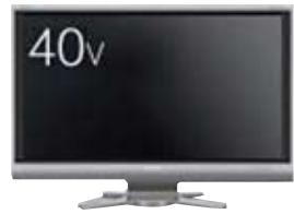
シャープ液晶テレビ アクオス40型